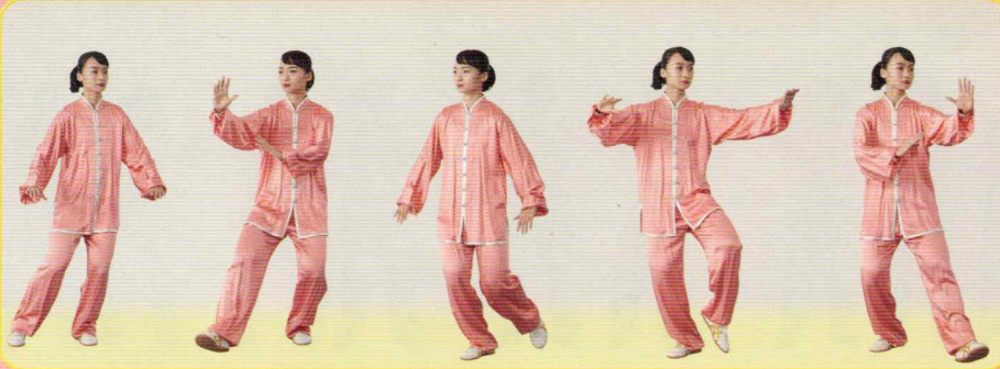
③ 手揮琵琶 ショウホイピーパ(右左)