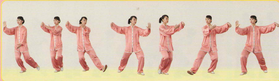
⑦ 十字手 シーズーショウ