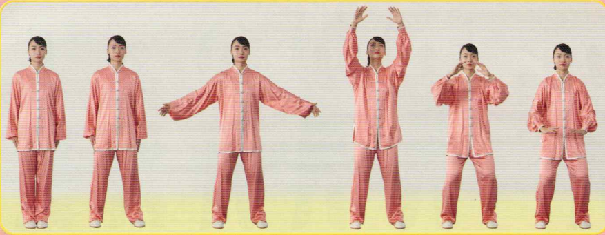
① 予備式 ユーベischer(2回)