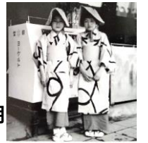
幼いころの写真(左)

下町野毛育ちの浜つ子。野毛坂を上がれば図書館、動物園、遊園地と憩いの場が沢山。家の周りは商店街、映画館5軒。春港祭り、夏神輿、正月獅子舞など、 活気に溢れた町 でした