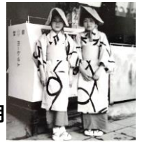
幼いころの写真(左)

下町野毛育ちの浜つ子。野毛坂を上がれば図書館、動物園、遊園地と憩いの場が沢山。家の周りは商店街、映画館5軒。春港祭り、夏神輿、正月獅子舞など、 活気に溢れた町 でした