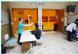
検温でコロナ対策

初心者からベテランまで、また、検定間近の方々もいて、2時間半の講習を大いに楽しみました。これを契機に太極拳に親しみ、また、協会クラブの仲間が増える良い機会になれば嬉しい限りです。