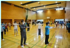
最後は全員で表演