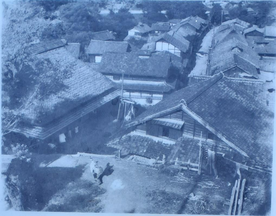
「宇津谷集落」 昭和初期

宇津ノ谷は丸子 まりこ 、岡部両宿 おかべりょうしゆく の間に位置する間宿 あいのしゆく です。 行交う旅人が、宇津ノ谷名物「十団子 とおだんご 」を求めたり、 無事に峠を越えてほっと息をついたところです。ここ からの眺めは昔も今も変わらず、山間 やまあい の集落の景観は、 当時 ほうふつ を彷彿とさせてくれます。